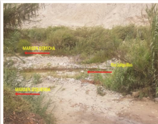
FIGURA N°13: INSPECCIONANDO LOS SECTORES CRÍTICOS EN EL RÍO JULQUILLAS, CAUCE DEL RÍO COLMATADO Y ENMALEZADO AMBAS MARGENES