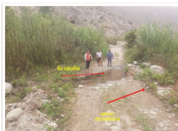
FIGURA N°12: INICIA TRAMO CRÍTICO EN EL RÍO JULQUILLAS, SECTOR COY COY - AUCAYCO, DISTRITO DE SAN PEDRO, PROVINCIA DE OROS - REGIÓN ANCASH. AMBAS MARGENES DESPROTEGIDOS, NECESITA LIMPIEZA, DESCOLMATACIÓN